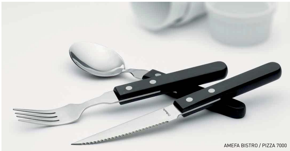
AMEFA BISTRO / PIZZA 7000