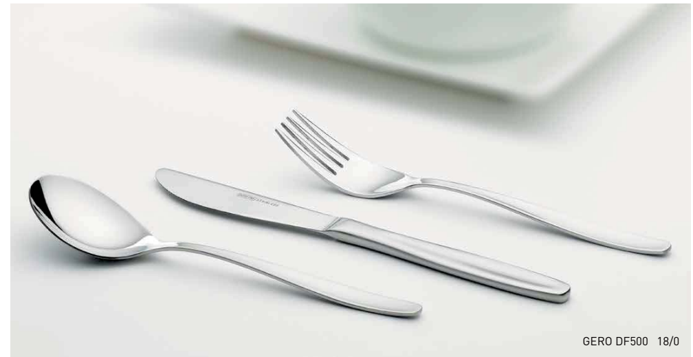
GERO DF500 18/0