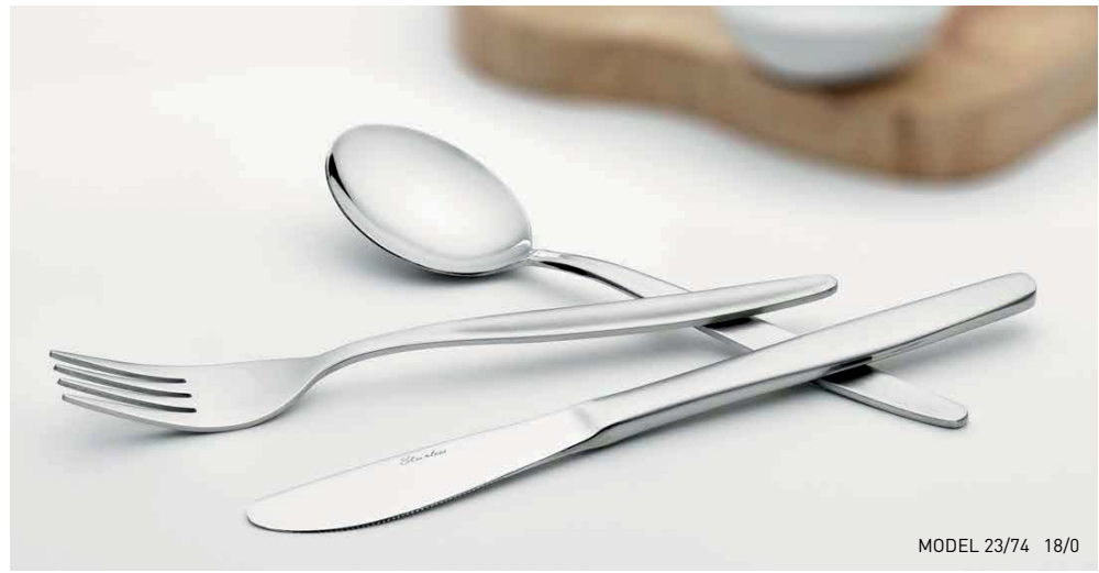
MODEL 23/74 18/0