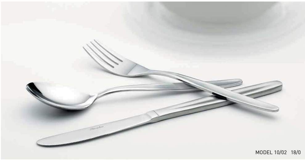
MODEL 10/02 18/0