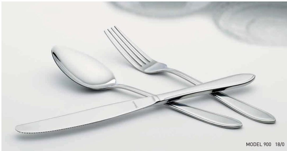
MODEL 900 18/0