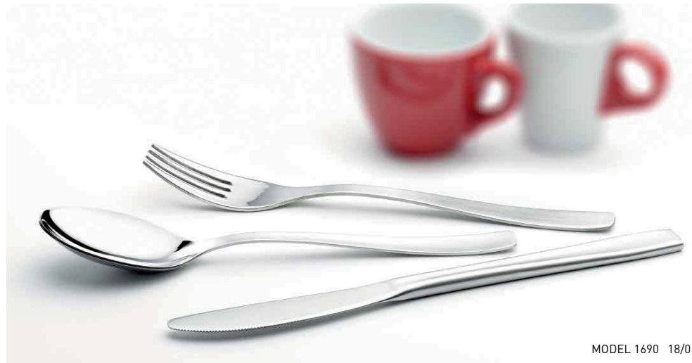
MODEL 1690 18/0