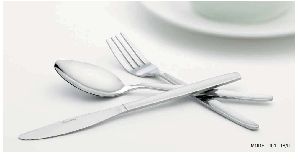
MODEL 001 18/0