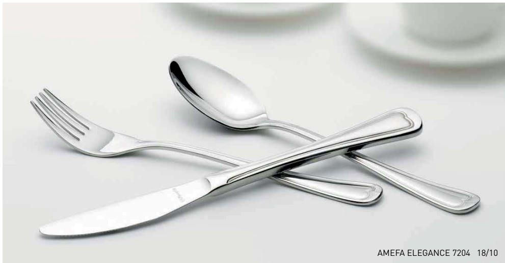
AMEFA ELEGANCE 7204 18/10