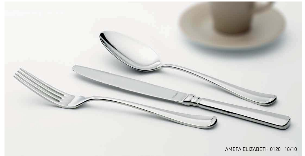
AMEFA ELIZABETH 0120 18/10